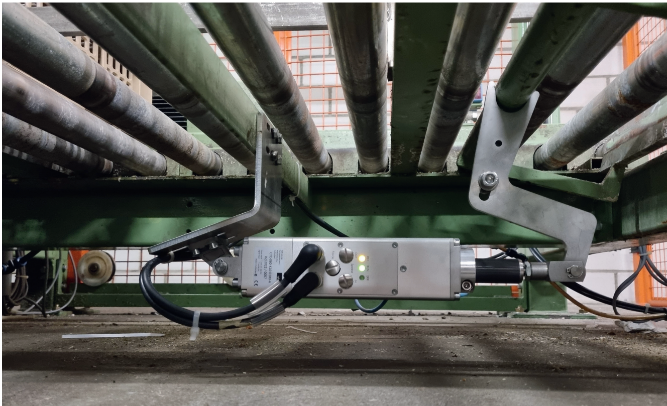
Einsatz von Elektrozylin- dern bei Micarna.