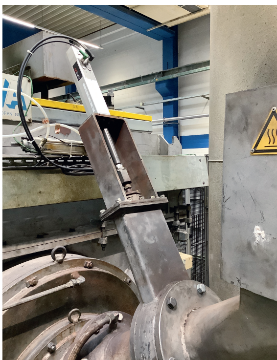
Bild 2 Die Firma Stihl Kettenwerk war eines der Unternehmen, bei denen Druckluftzylinder durch Elektrozyylinder ersetzt wurden.

werden. Grundlage der Berechnung war der Einsatz von Elektrozyindern in mehreren Pilotbetrieben.