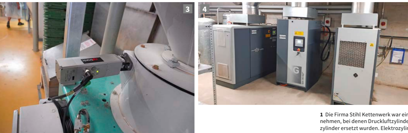
1 Die Firma Stihl Kettenwerk war eines der Unternehmen, bei denen Druckluftzylinder durch Elektrozyylinder ersetzt wurden. Elektrozyylinder dürften wegen ihrer hochwertigen Komponenten den Druckluftzylindern bezüglich Lebensdauer überlegen sein.